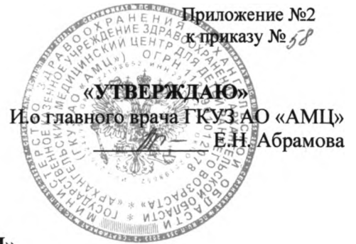
ГРАФИК дежурных ГКУЗ АО «АМЦ» в период с 28 апреля 2024 по 12 мая 2024 года