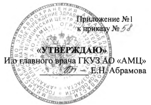
ГРАФИК ответственных дежурных ГКУЗ АО «АМЦ» в период с 28 апреля 2024 по 12 мая 2024 года